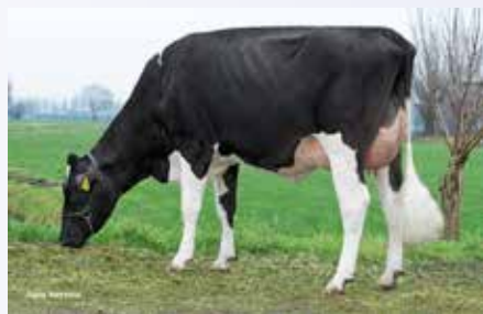
Guard dochter Jonker Stoffelina 348

Met nu 135 Nederlandse dochters en 241 Duitse dochters in zijn fokwaarde steeg de productie van de Duitse stier Guard naar 510 kg met daarbij torenhoog eiwit (+0,36%). Guard stijgt maar liefst 6 punten voor benen en wist zijn goede bevruchtingsresultaten van +3 mooi op peil te houden. Compacte niet te grote koeien met hoge gehalten is wat Guard u kan geven.