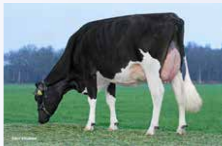
Guard dochter Sterk Mascuard

Terug op de kaart is Surefire . Deze Ramoszoon vererft via zijn ruim 700 dochters 1546 kg melk. Zijn dochters maken een enorme stap van vaars naar tweede kalfs dieren. De vaarzen zijn laatrijp en zijn degelijk gebouwd, hebben een spiertje extra en kunnen de hoge productie van met name de tweede lijst prima aan. Gebruikers van het tripleA systeem zijn vaak op zoek naar stieren met een 6 in de code. Surefire heeft code 645 hetgeen betekent dat hij veel kracht en balans doorgeeft. Een prima 6 stier met veel vooruitgang van produktie. Ook geschikt voor melkrobots.